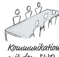
Kommunikation mit dem SWD